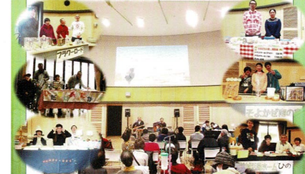
平成29年3月15日/横浜医療福祉センター港南ホール