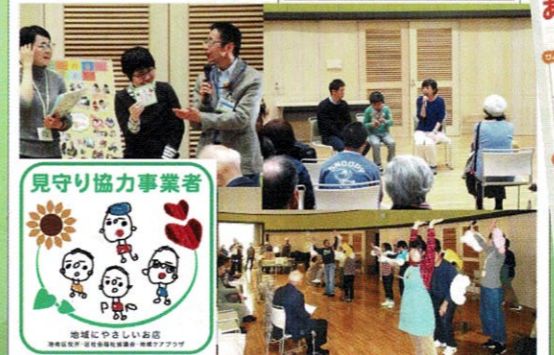
平成30年3月18日/横浜医療福祉センター港南ホール