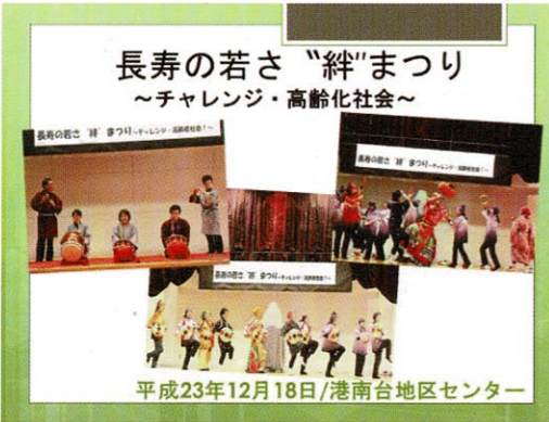
長寿の若さ “絆”まつり ～チャレンジ・高齢化社会～