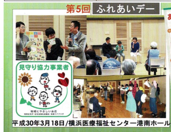
第5回 ふれあいデー