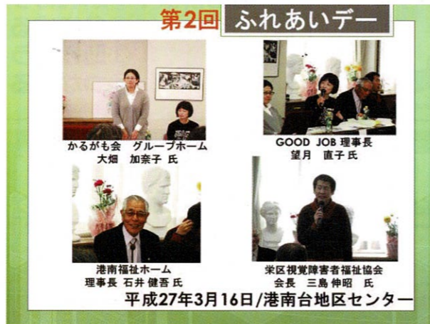
第2回 ふれあいデー