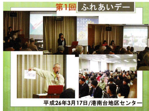
第1回 ふれあいデー