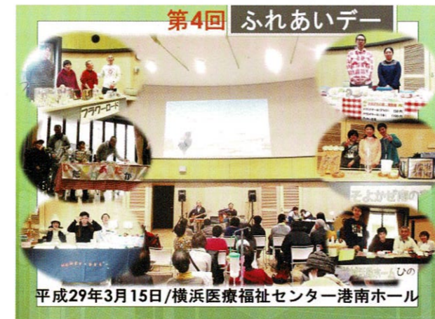
第4回 ふれあいデー