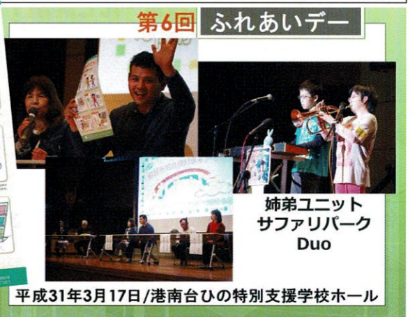
第6回 ふれあいデー