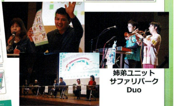
平成31年3月17日/港南台ひの特別支援学校ホール